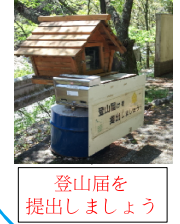
登山祠を提出しましょう

大台ヶ原 駐車場 1.9Km 日出ヶ岳 ◀ 2.3Km ▶ シャクナゲ坂 ▶ 2.6Km ▶ 堂倉滝 ▶ 2.3Km ▶ 七ツ釜滝 ▶ 2.4Km ▶ シシ淵 ▶ 4.5Km ▶ 登山口